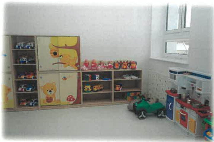
Zdjęcie: Samorządowy żłobek „Psołta Andzia” w Przecławiu-wnętrza