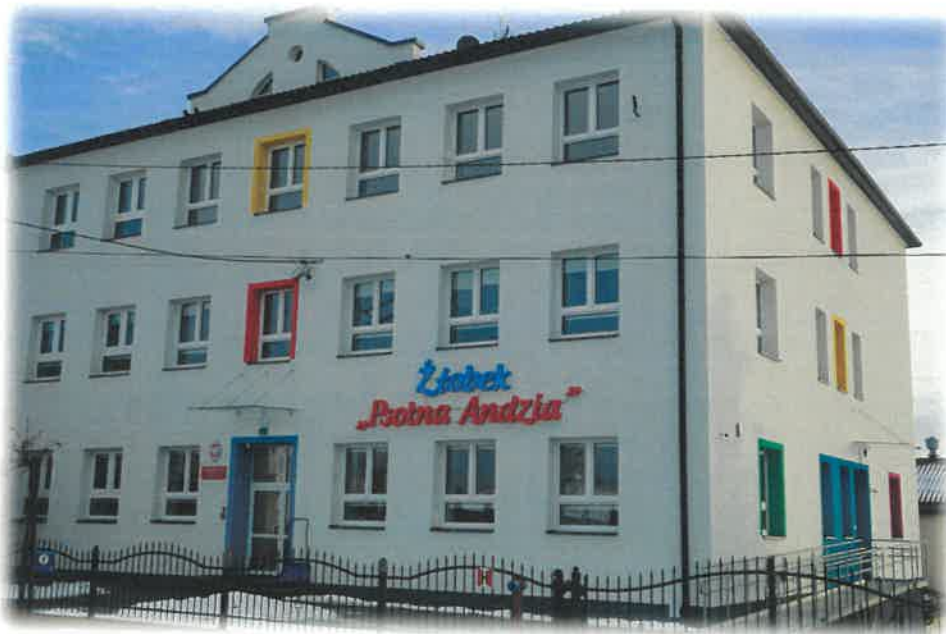
Zdjęcie: Samorządowy żłobek „Pisna Andzia” w Przecławiu