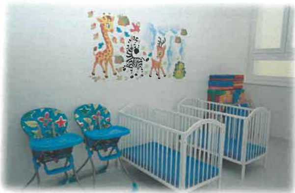
Zdjęcie: Samorządowy żłobek „Psołta Andzia” w Przecławiu-wnętrza