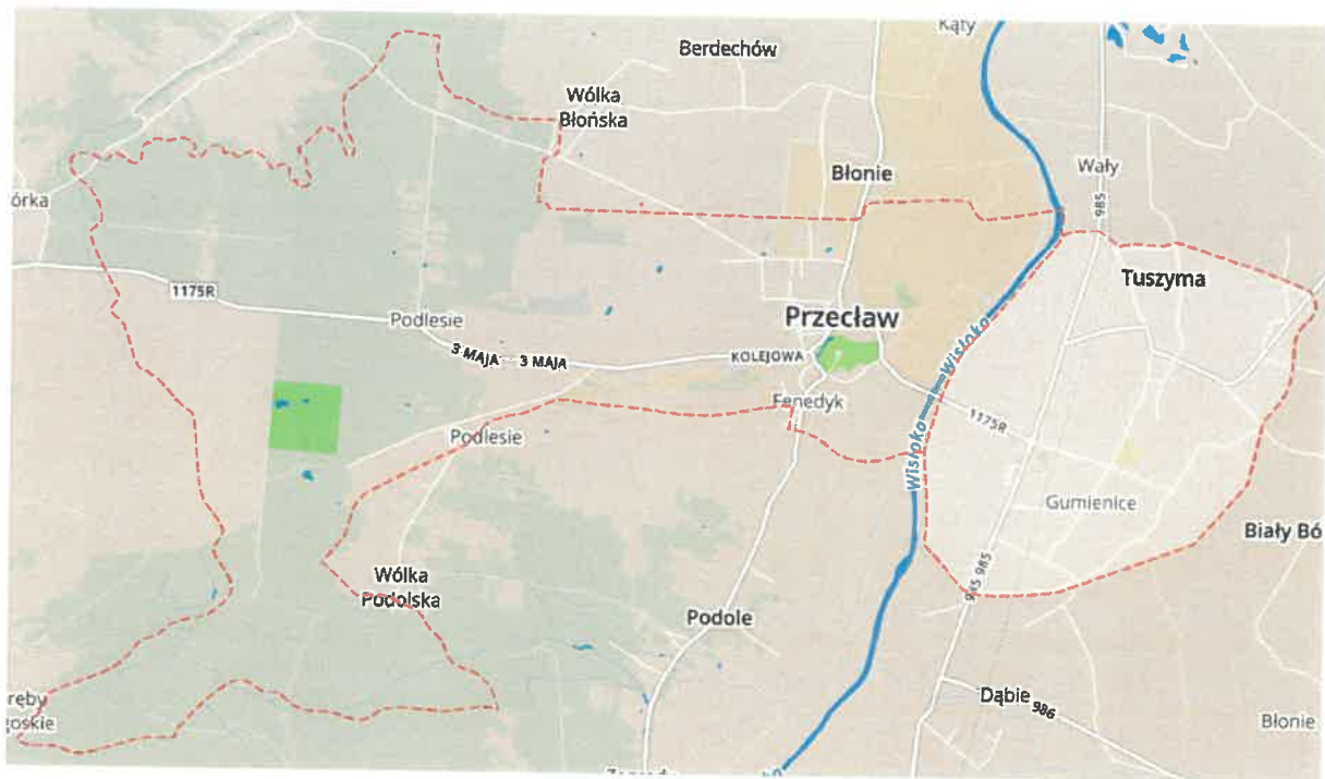
Grafika Obszar rewitalizacji

Podobszar miasta Przeclaw znajduje się w lewobrzeżnej części gminy Przeclaw. Obejmuje teren o powierzchni 1 630 ha i jest aktualnie zamieszkiwany przez 1 709 mieszkańców. Jest to jedyna jednostka terytorialna gminy posiadająca prawa miejskie, które odzyskała w 2010 roku. Miasto Przeclaw pełni funkcję ośrodka społeczno-gospodarczego gminy, którego przedłużenie funkcjonalne stanowi sołectwo Tuszymia. W zachodniej części obszaru znajduje się rynek, z którego odchodzą kolejne drogi w kierunku poszczególnych sołectw, Urząd Miejski, Samorządowy Żłobek, dom kultury oraz niewielkie punkty handlowo-usługowe. Na południe od rynku zlokalizowany jest XVI wieczny zamek wraz z przylegającym parkiem – teren ten jest atrakcyjny turystycznie, na dzień dzisiejszy pozostaje własnością prywatną udostępnianą mieszkańcom gminy i turystom. W kierunku zachodnim gęstość zabudowań maleje na rzecz terenów zalesionych.