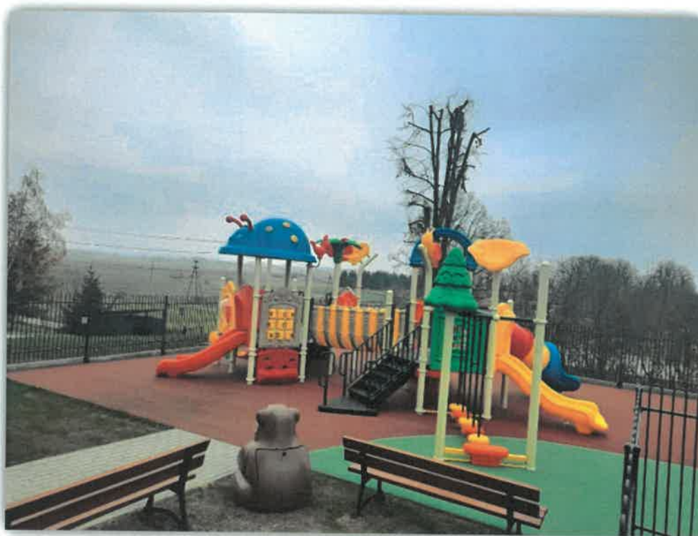
Zdjęcie: Samorządowy żłobek „Psozna Andzia” w Przecławiu-plac zabaw