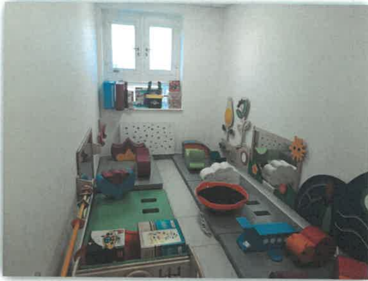
Zdjęcie: Samorządowy żłobek „Psozna Andzia” w Przecławiu-sala sensoryczna