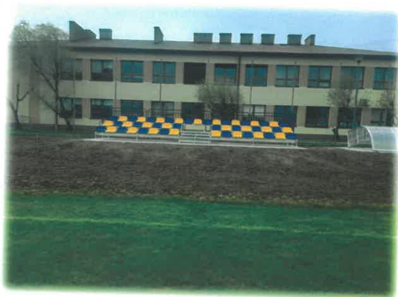
Stadion w Tuszynie