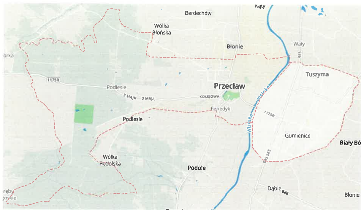
Grafika Obszar rewitalizacji

Podobszar miasta Przeclaw znajduje się w lewobrzeżnej części gminy Przeclaw. Obejmuje teren o powierzchni 1 630 ha i jest aktualnie zamieszkiwany przez 1 709 mieszkańców. Jest to jedyna jednostka terytorialna gminy posiadająca prawa miejskie, które odzyskała w 2010 roku. Miasto Przeclaw pełni funkcję ośrodka społeczno-gospodarczego gminy, którego przedłużenie funkcjonalne stanowi sołectwo Tuszyma. W zachodniej części obszaru znajduje się rynek, z którego odchodzą kolejne drogi w kierunku poszczególnych sołectw, Urząd Miejski, Samorządowy Żłobek, dom kultury oraz niewielkie punkty handlowo-usługowe. Na południe od rynku zlokalizowany jest XVI wieczny zamek wraz z przylegającym parkiem – teren ten jest atrakcyjny turystycznie, na dzień dzisiejszy pozostaje własnością prywatną udostępnianą mieszkańcom gminy i turystom. W kierunku zachodnim gęstość zabudowań maleje na rzecz terenów zalesionych.