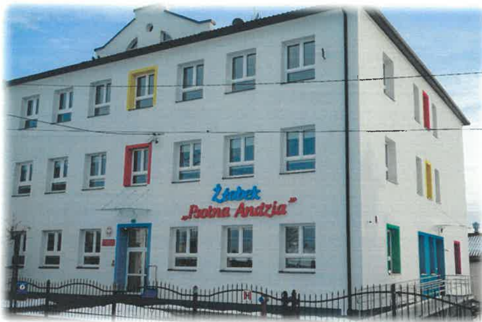
Zdjęcie: Samorządowy żłobek „Pisotna Andzia” w Przecławiu